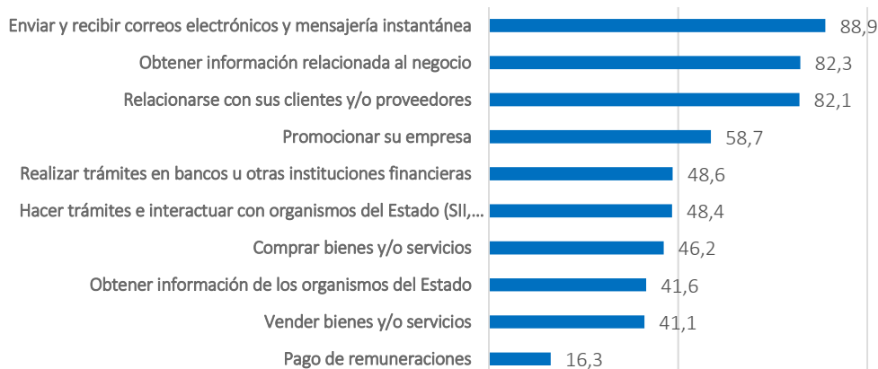
Usos laborales de internet (en %)

Quizás los micro-emprendedores requieran aún más apoyo para aprovechar mejor el uso de la herramienta, lo cual sin duda abre una ventana de oportunidad para nuestros servicios.